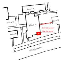
scara 1 : 2880